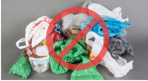
Feestaalii fi filmii

Kanneen armaan gadii adeemsa deebisanii faayidaarra oolchuu irratti rakkoo uumu, sababni isaas meeshaa keessatti cuqqaalamu, hojjettoota irraan miidhaa ga'uu danda'u, akkasumas meeshaa haaraan irraa yoo oomishame meeshaaleen sunniin gabaa gaarii hin argatan. Meeshaalee irra-deebiin oomishamanitti hin dabaln. hennepin.us/recycling irraa dabalataan baruu ni dandeessa.