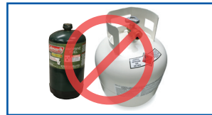
Siliindaroota ukkaamfamoo (piroopeenii, hiliyeemii, CO2)