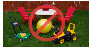
Meeshaalee pilaastikaa guguddoo fi ashaangulliitiwwan