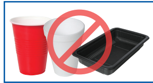
#6 fi pilaastika gurraacha