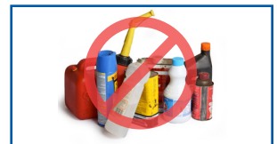
Baattuwwan oomishaalee balaa geessisan qaban

Karaawwan ittiin gatan kan wantoota kanniinii fi kanneen dabalataa hedduu Giriin Dispoozal Gaayid irraa hennepin.us/green-disposal-guide irraa barbaadaa.