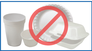
Ispoonjii pilaastikaa (Styrofoam™)