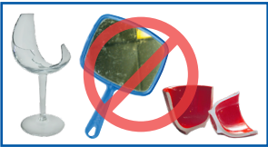
Saaniwwan fullee, mastaawotii foddaa fi supheewwan