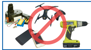
Elektirooniksii fi baatiriiwwan