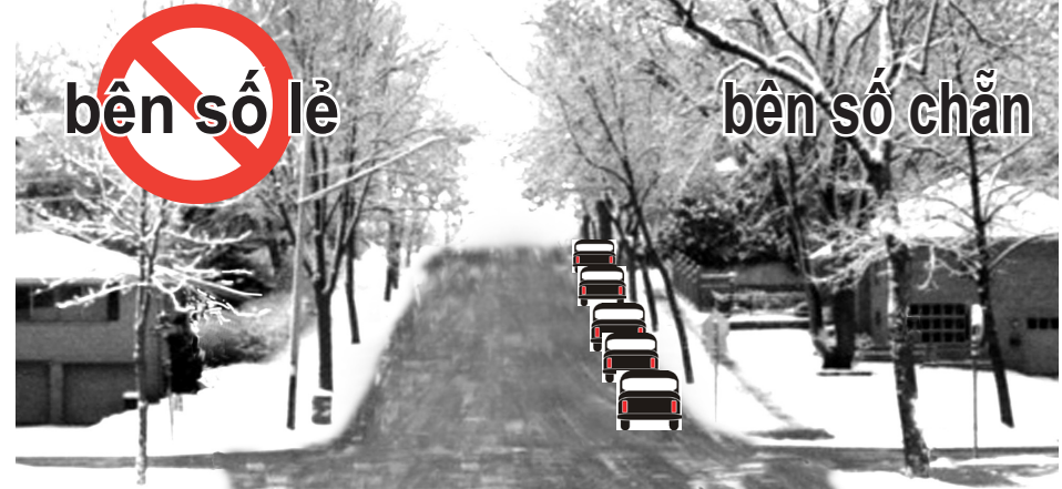
Example of non-Snow-Emergency-route street

Lúc 8 giờ sáng luật đậu xe trong Ngày 3 sẽ bắt đầu.