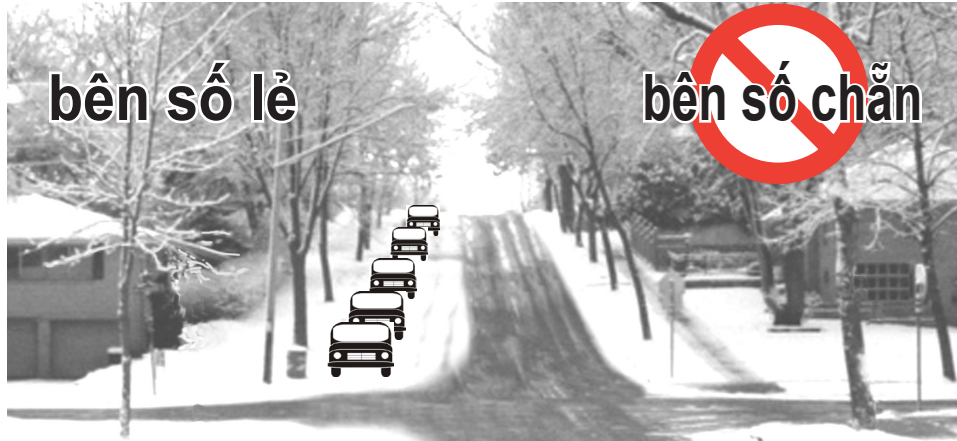
Example of non-Snow-Emergency-route street

Lúc 8 giờ sáng luật đậu xe trong Ngày 2 sẽ bắt đầu.